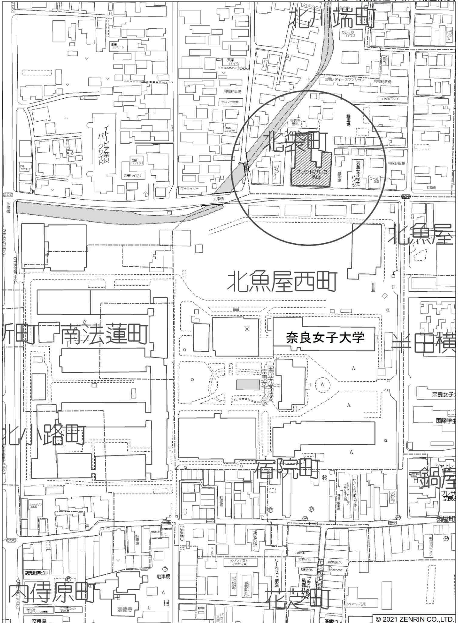
奈良市北魚屋西町付近